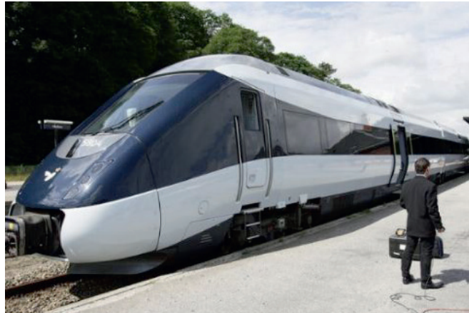
DSB IC4 ANSALDOBREDA

AnsaldoBreda S.p.A. ist ein italienischer Schienenfahrzeughersteller, der seit 2015 zum japanischen Mischkonzern Hitachi Rail Italia gehört. In der Nähe von Mailand werden mit rund 450 MitarbeiterInnen u.a. Hochgeschwindigkeitszüge der Baureihe IC4 für den Fernverkehr des dänischen Eisenbahnunternehmens Danske Statsbaner (DSB) hergestellt. Es gab bei der Auslieferung bzw. im Betrieb seit 2005 bereits mehrfach Komplikationen und die Züge galten als mangelbehaftet. Unsere Beratungsaktivität im Jahr 2015 war auf die Detektion mechanischer Mängel an Druckgusskomponenten gerichtet.